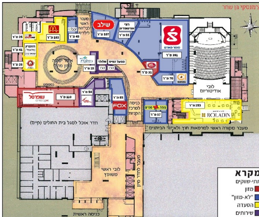
מפת: פריסת חנויות במרכז המסחרי רמב"ם היום