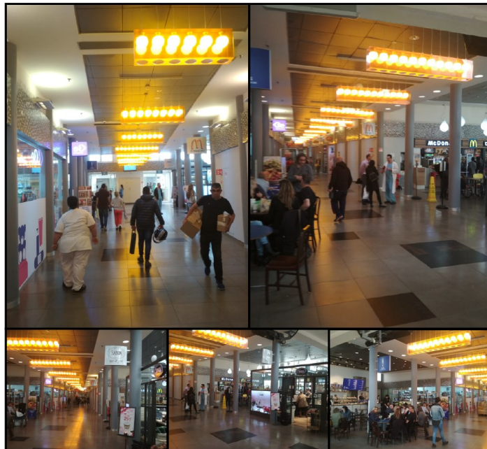
תמונה: מרכז מסחרי במאיר